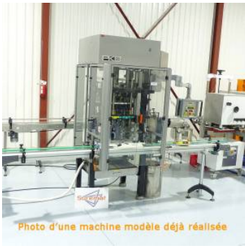
Photo d'une machine modèle déjà réalisée